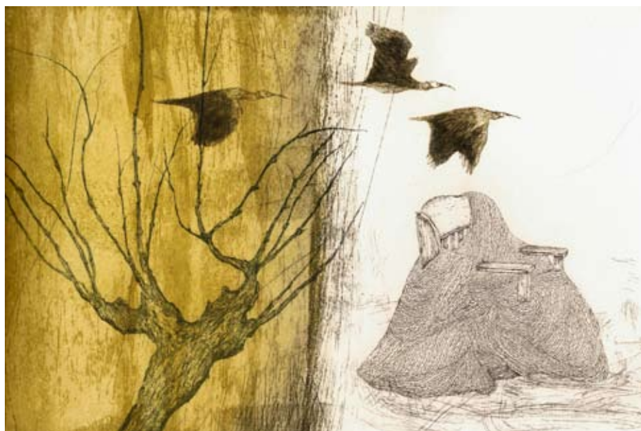
En haut : « Elixir », eau-forte, photopolymère, aquatinte, 40x50 m